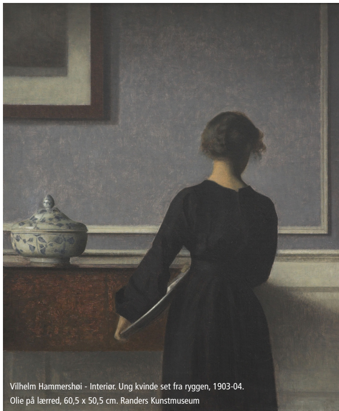
Vilhelm Hammershøi - Interiør. Ung kvinde set fra ryggen, 1903-04. Olie på lærred, 60,5 x 50,5 cm. Randers Kunstmuseum

Så er det tid til at runde af og sige på gensyn til Nyborgmødet 2023 . Det gør vi inden frokost.